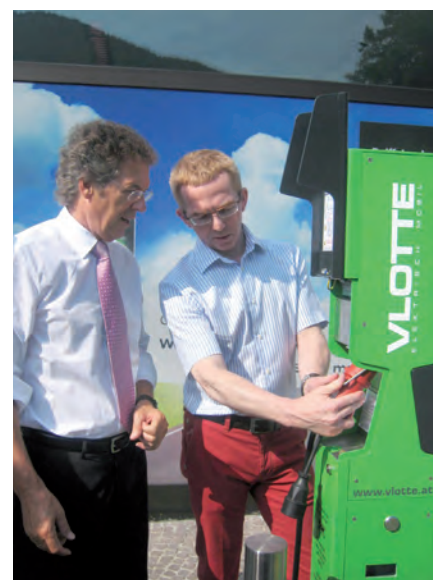
Akkus von Elektroautos können bei der Raiffeisenbank Bludenz problemlos aufgeladen werden.

Der Mitsubishi i-MiEV ist das erste Großserien E-Fahrzeug der Welt, das mit einem reinen Elektroantrieb ausgestattet ist. Mit einer Reichweite von rund 160 km und einer Spitzen-