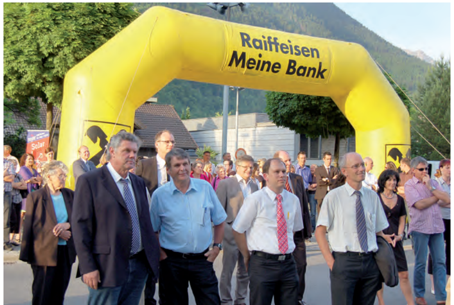
Gäste bei der 109. Generalversammlung der Raiffeisenbank Bludenz

Über die Erfahrungswerte der „VLOTTE“-Projekte sowie über die aktuell verfügbaren alternativ angetrie-